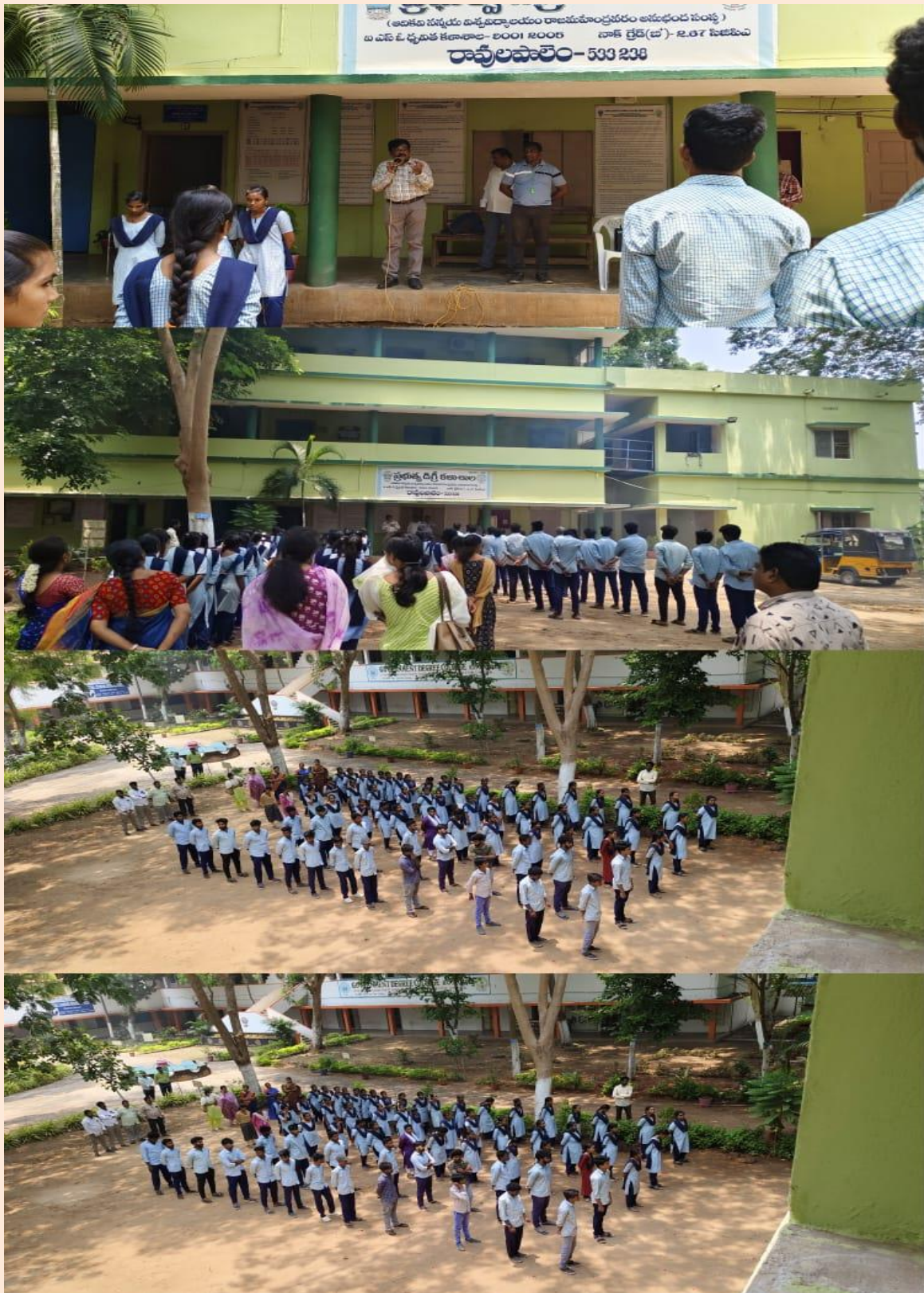
Principal, Staff and Students at General Assembly