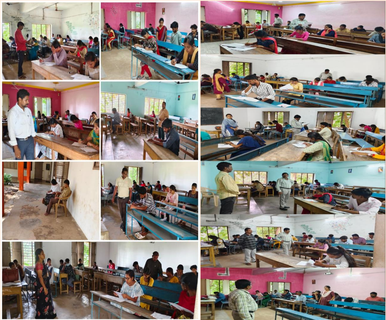
Inspection of University Squad at University Sem-End Examinations