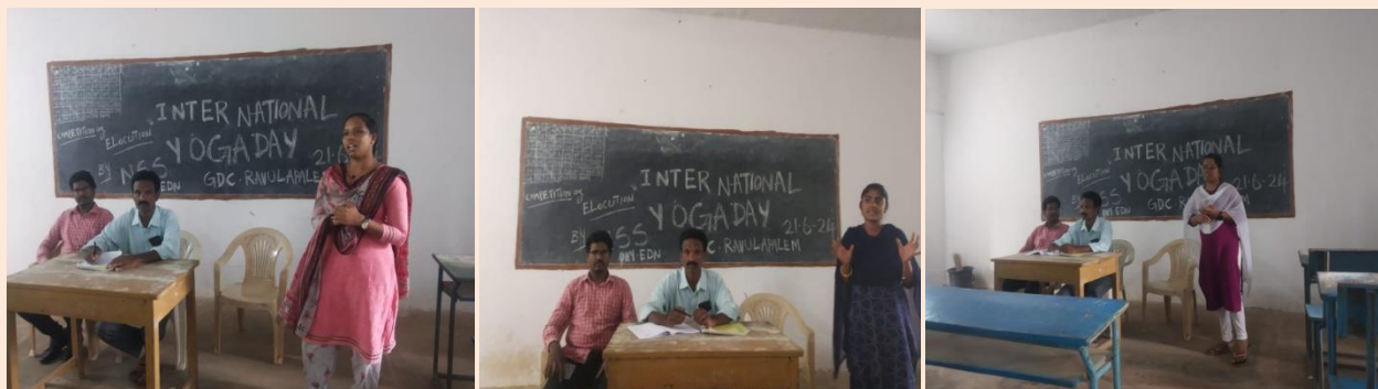
Elocution competition conducted for students on the occasion of International Yoga Day on June 21 st June 2024 by NSS