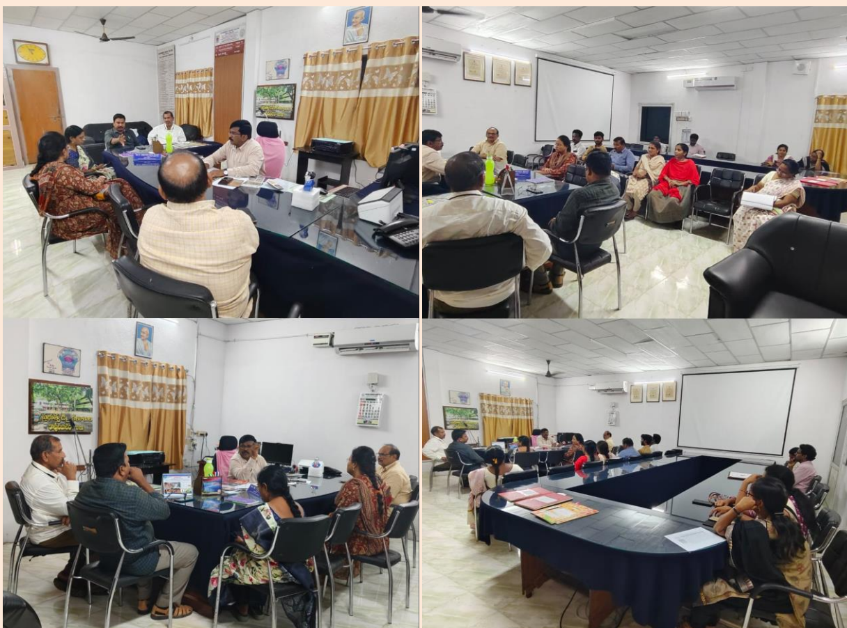
Principal discussing various academic issues at staff meetings held in the month of June, 2024