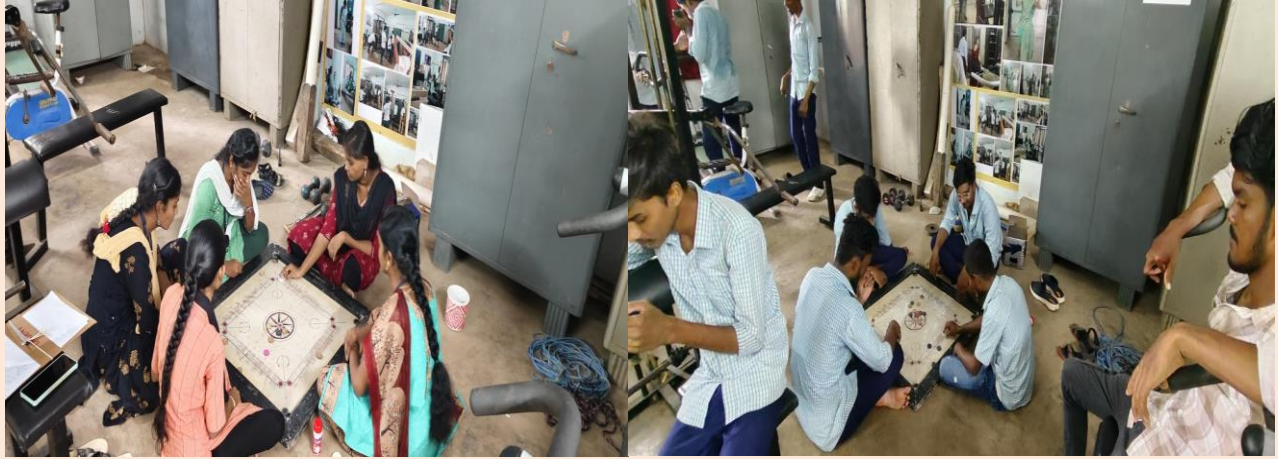
Sports and Games Practice was done by students on the occasion of College Annual Day