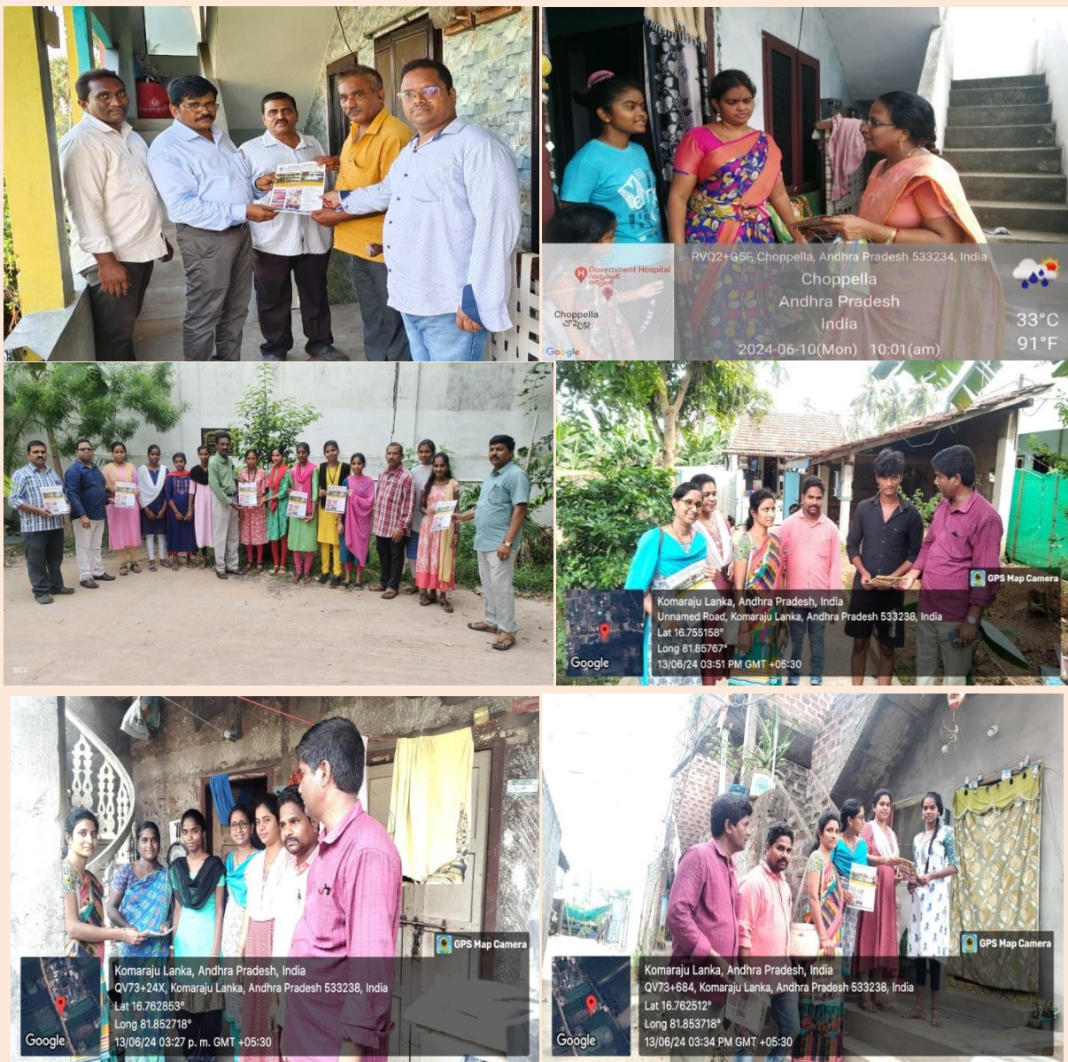
Admission Campaign at in and around Ravulapalem Mandal by Principal and Staff