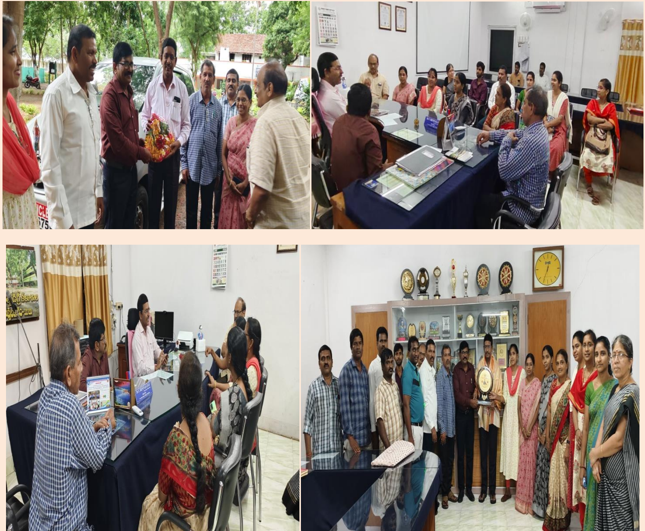
Principal, Vice Principal and Staff honouring JD Sir